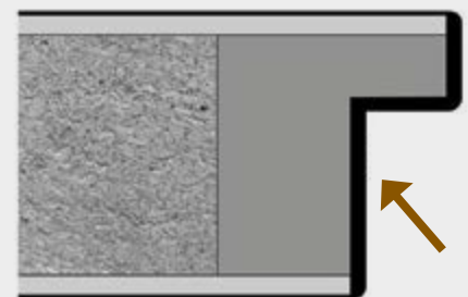
Premiumkante, hochwertige Premiumkante als 2 mm Dickkante