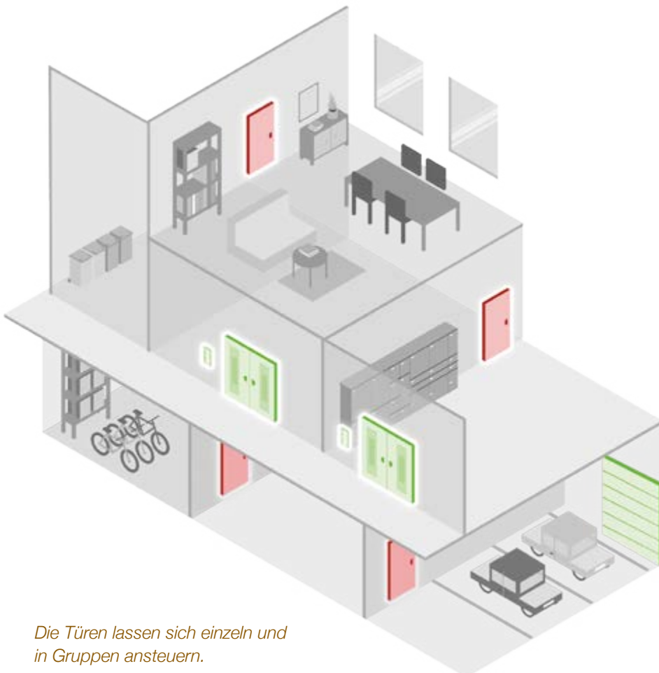
Die Türen lassen sich einzeln und in Gruppen ansteuern.